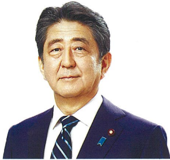
安倍 晋三 総裁

新型コロナウイルスとの戦いという歴史的な事態に直面している今、国民の皆さまには大変な不自由をおかけしています。この難局を私たち全員の力で乗り越えていくため、世界的に見ても最大級の緊急経済対策を打ち出し、その財政的な裏付けとなる今年度補正予算を成立させました。引き続き、「感染拡大の防止」「医療提供体制の強化」に最優先で取り組むとともに、緊急経済対策の速やかな実行により、皆さまの暮らしと経済を力強く支えてまいります。