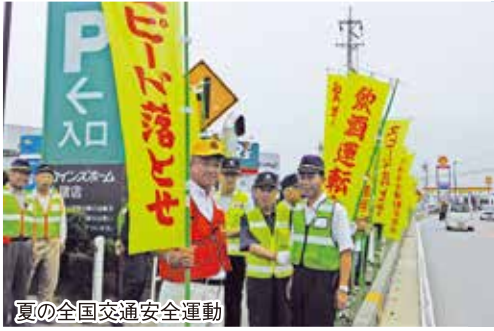
夏の全国交通安全運動