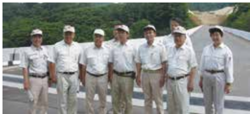
中部横断自動車道のインター取付道路の視察(佐久穂町)

7月21、22日に県議会危機管理建設委員会の現地調査が、小諸・佐久両市を中心に広域で行われました。