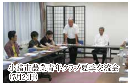
小諸市農業青年クラブ夏季交流会(7月24日)