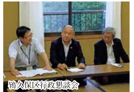
鶴久保区行政懇談会