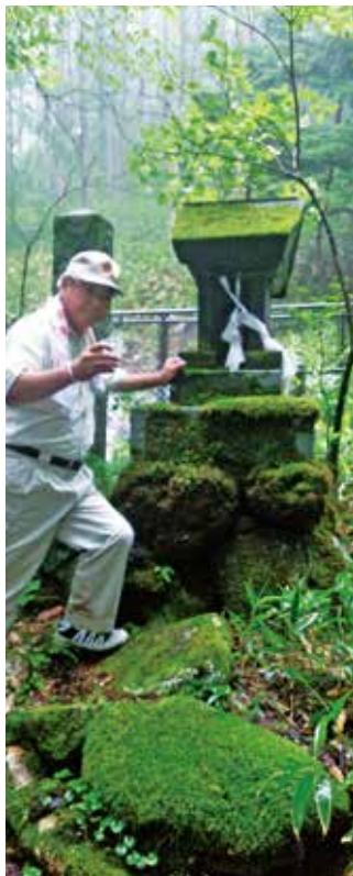
御牧ヶ原水源池視察。ここから60kmにわたり、御牧ヶ原に水が送られています。水の大切さ、有難さを再認識しました。