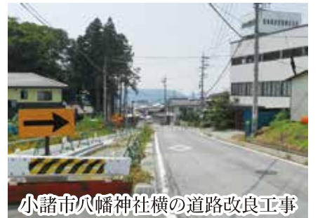
小諸市八幡神社横の道路改良工事