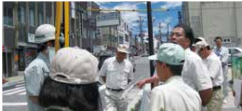
市内相生町の県道工事の視察。9月15日に舗装工事が完了予定。