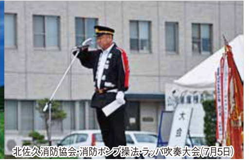
北佐久消防協会、消防ポンプ操法・ラッパ吹奏大会(7月5日)