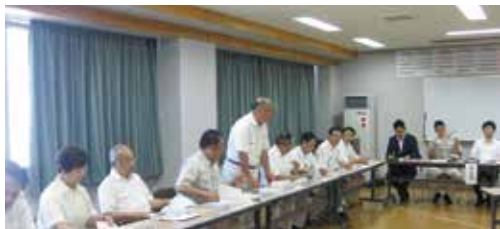
噴火警戒レベルが2となった浅間山の、火山防災の現地調査(軽井沢町)

今年度、危機管理建設委員会委員長に就任。道路網の整備の他、災害に強い安全な暮らしの実現に向けて活動しています。