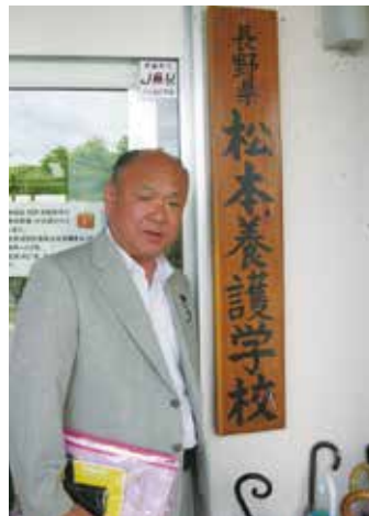
松本養護学校視察(7月13日)。同校にて県政対話集会が開催されました。詳細は裏面をご覧ください。